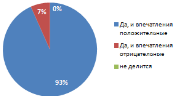
3. Делится ли впечатлениями Ваш ребенок после участия в интенсивной школе *