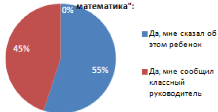
2. Знаете ли Вы о том, что в школе работает проект "Прикладная математика":