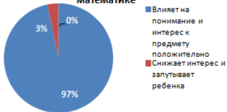
1. Участие в проекте Вашего ребенка по математике